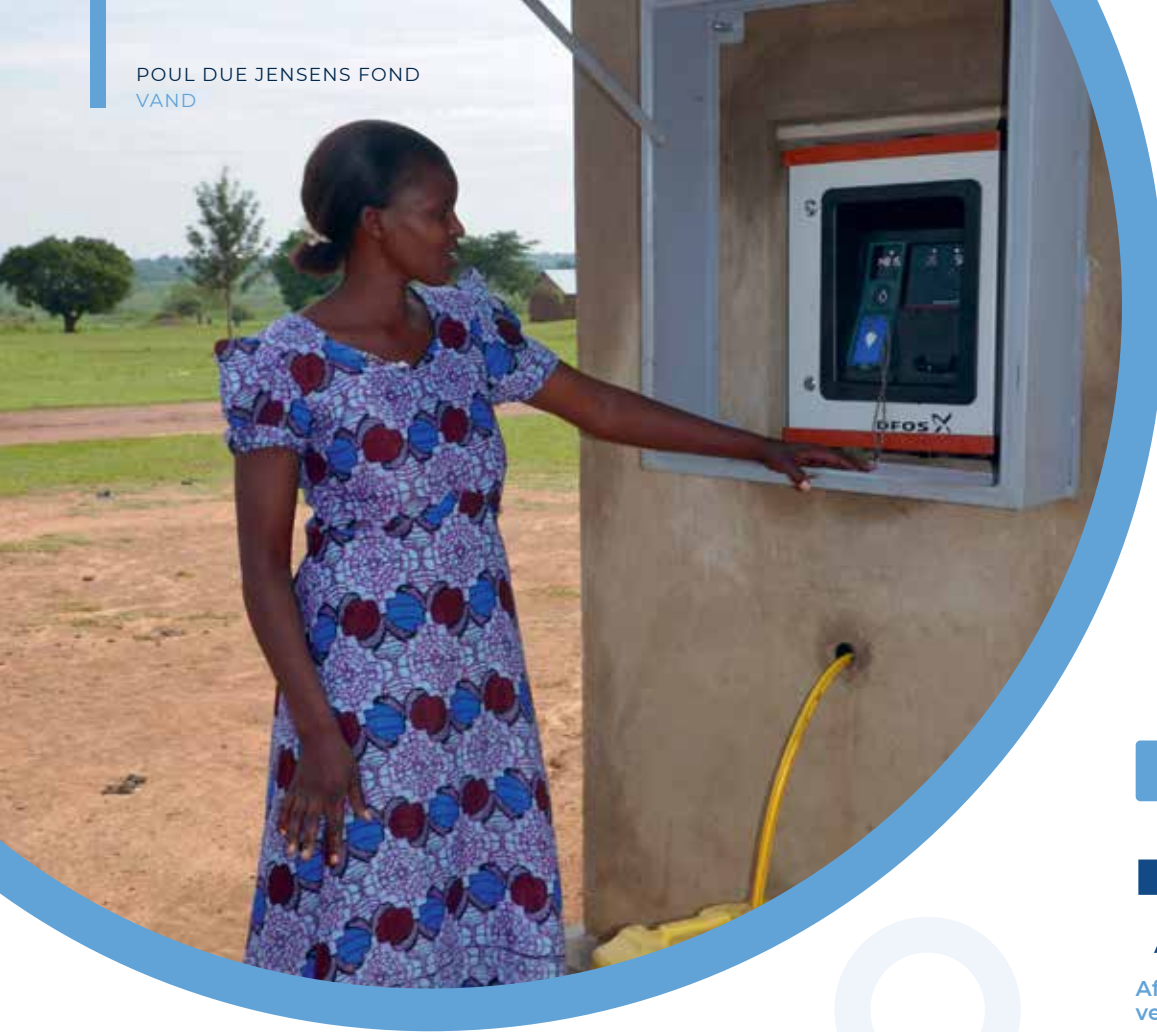
Vandtapning fra Grundfos AQtap, vand dispenser.