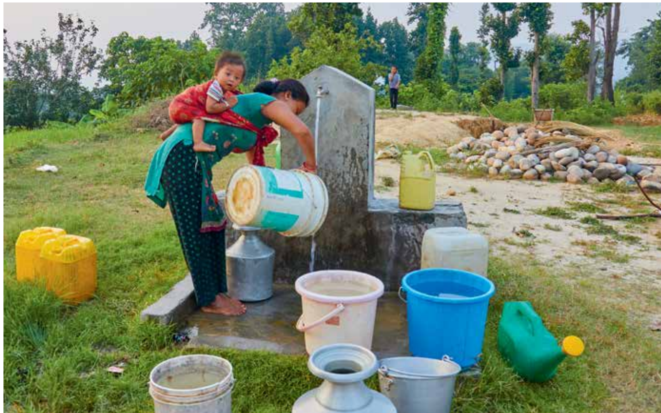
De fleste mennesker skal gå mindre end 100 meter for at hente vand.